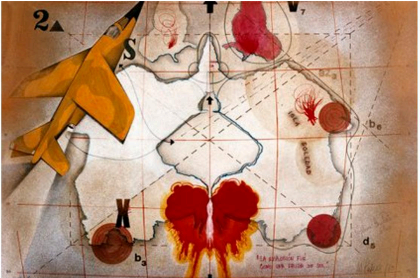
Mariposa y bahía labial

Entre los trabajos que destacó Giunta se encuentra: “ Es tarde , una escritura encriptada, secreta (hay que encontrar las palabras), de la colección de Malba, de 1976, parece condensar el terror que se vivía en esos años en Argentina”, Tiempo de descuento. Cuenta regresiva. La hora 0 , un video de 1978 se relaciona con el mismo clima de angustia, de huida. Esta obra estuvo en la exposición Mujeres Radicales , en el Hammer”.